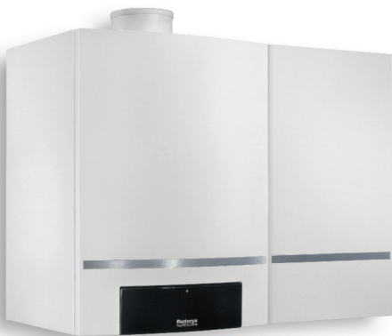
Logamax plus GB162 cu boiler stratificat de 40 de litri

Centrala termică Logamax plus GB162 economisește atât energie, cât și spațiu. Formatul său extrem de compact vă aduce un mare avantaj, întrucât fiecare centimetru în minus înseamnă mai multă libertate în alegerea spațiului în care se va monta. Instalația poate fi amplasată în orice nișă sau colț de încăpere și se remarcă prin montarea foarte simplă. Un avantaj în plus: în funcție de preferință Logamax plus GB162 vă va răsfăța și cu un confort deosebit de apă caldă.