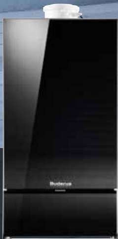
Centrală termică murală cu condensare, pe gaz Logamax plus GB172i